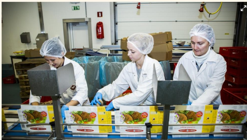
Ergon investeerde onder meer in Vanreusel Snacks.

De familie Frère haalt 580 miljoen euro op voor haar vierde Ergon-fonds. Opmerkelijk: de participatie van de Frères zakt voor het eerst onder de grens van 50 procent.